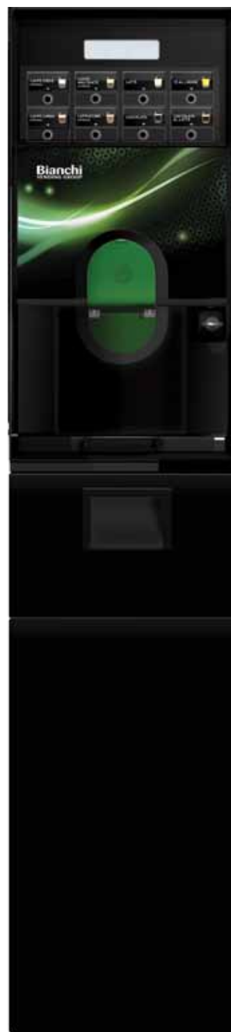
GAIA STYLE + UNDERSKÅP